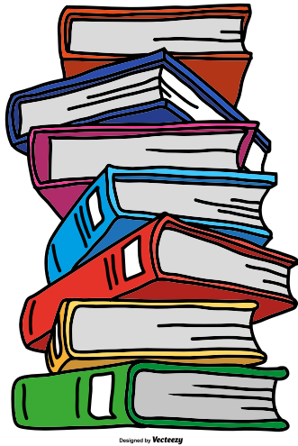
Designed by Vecteezy